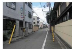
7、見える風景は上記 そのまま歩くと左手にギャラリーがあります