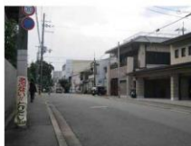
5、上記風景が見えてきたらあと少し！ 周辺目印はコンビニのヤマザキ、 パスタ屋ひなたさん、同志社大学新町キャンパス。