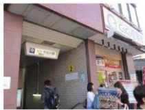
1、今出川駅2番出口 地上に出て左側へ進む (coco 寄る方向) 【烏丸通り】