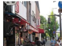
3、京楽食堂を左に曲がる 【上立売通り】に入ります しばらくまっすぐ。カフェAMUCAさんを超えて、 くまや整骨院さんを超えて・・・