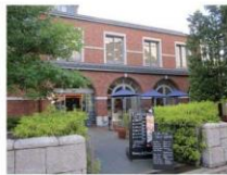
2、同志社カフェレストラン アマーク デ パラディー寒梅館を左手に見ながら通過 雰囲気がよくお手軽価格のお店です